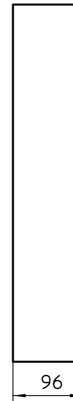
SA links 1